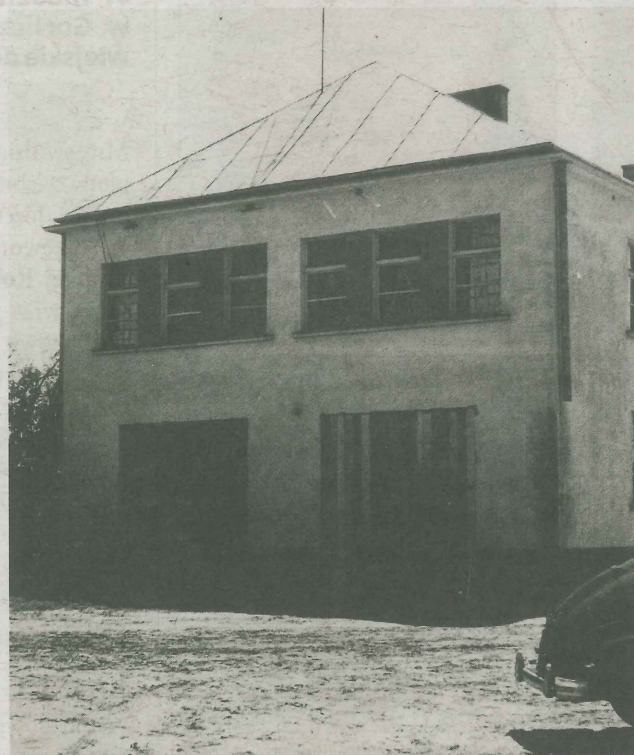
Stara remiza strażacka OSP Ubieszyn, lata 60. XX w.

Już trzy lata po powstaniu OSP, w 1927 r., strażacy zaczęli organizować festyny strażackie oraz inne imprezy dochodowe celem zgromadzenia środków na zakup sikawki strażackiej ręcznej. Po zakupie sikawki, z powodu braku jakiegokolwiek pomieszczenia na jej przechowywanie, strażacy wspólnie z radą wiejską postanowili własnymi siłami zbudować drewnianą remizę strażacką, wykorzystując drzewo z lasu wiejskiego. Zgromadzony materiał m.in. deski, ulokowano w zabudowaniach jednego z członków OSP. Budowy jednak nie rozpoczęto z powodu pożaru, który zniszczył wszystko doszczętnie. Sikawkę przechowywano w prywatnych