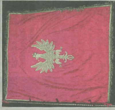
Muzeum w Przeworsku

telewizyjnych, 28 audycji radiowych, 6 materiałów online za pomocą profilu społecznościowego FB oraz kanałów YT Muzeum i Pożarnictwa na Facebooku - 220 postów na Facebook Muzeum w Przeworsku Ze-spół Pałacowo-Parkowy; - 60 wpisów na Instagramie; - 64 wpisy na stronie www.muzeum-przeworsk.pl (liczba odsłon strony - 3 875 059); - 3 publikacje wydawnicze: „Od wstępnej środy do Zielonych Świątek” K. Ignas, „Katalog zbiorów Muzeum Pożarnictwa w Przeworsku” W. Kruka, „Bożogroby Przeworscy” pod red. Ł. Mroza i Sz. Wilka; - 2 projekty z Ministerstwa Kultury i Dziedzictwa Narodowego;