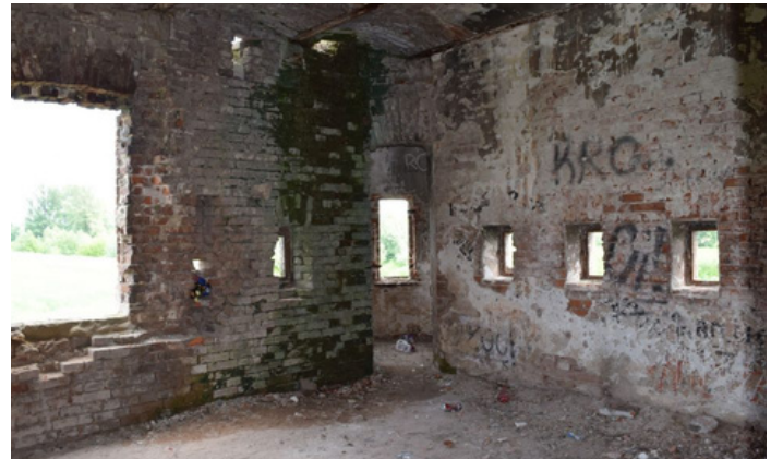
Ruiny strażnicy przed odbudową