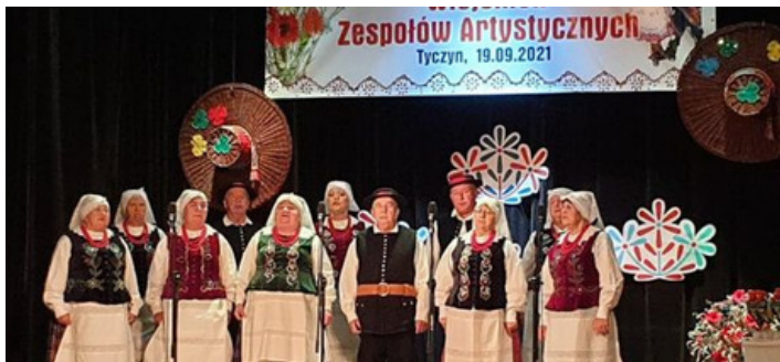
XXVI Wojewódzki Przegląd Wiejskich Zespołów Artystycznych w Tycynie 9 września 2021 r.