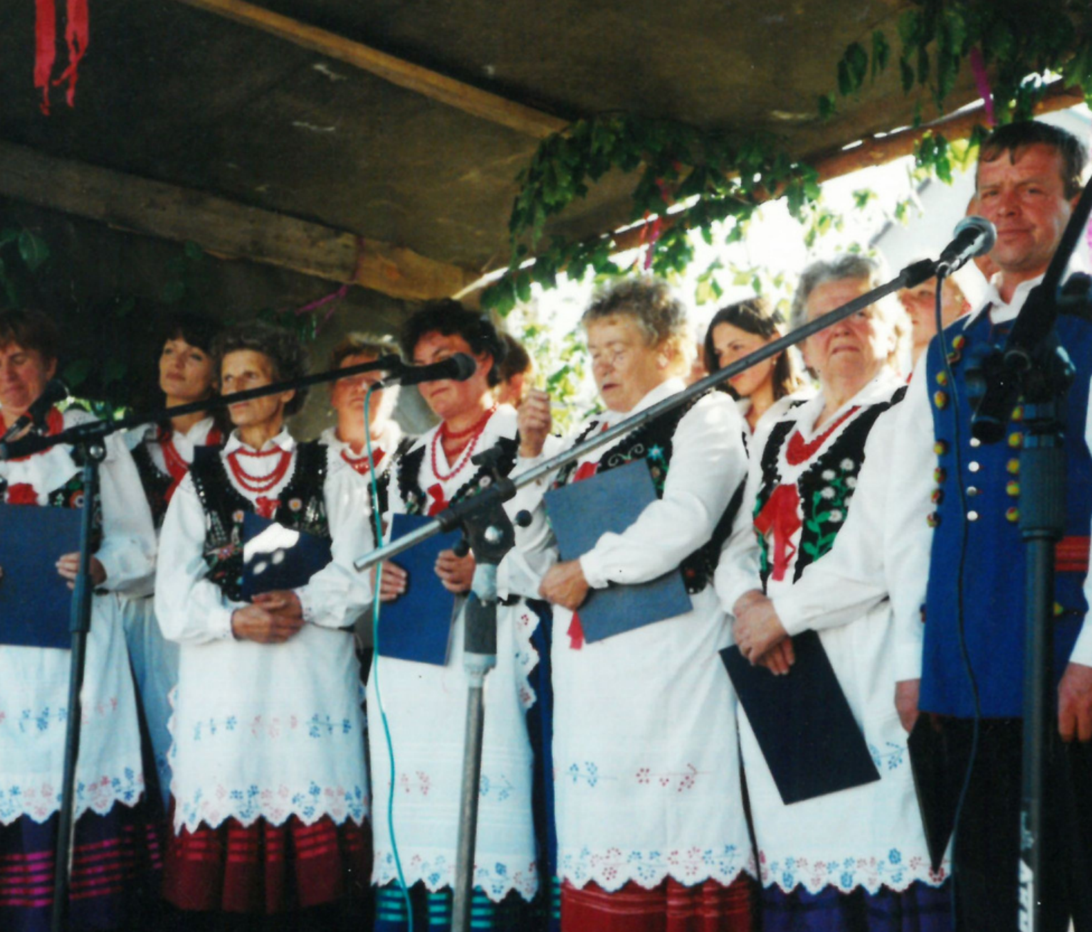
Dożynki w Medyce 2002 r.