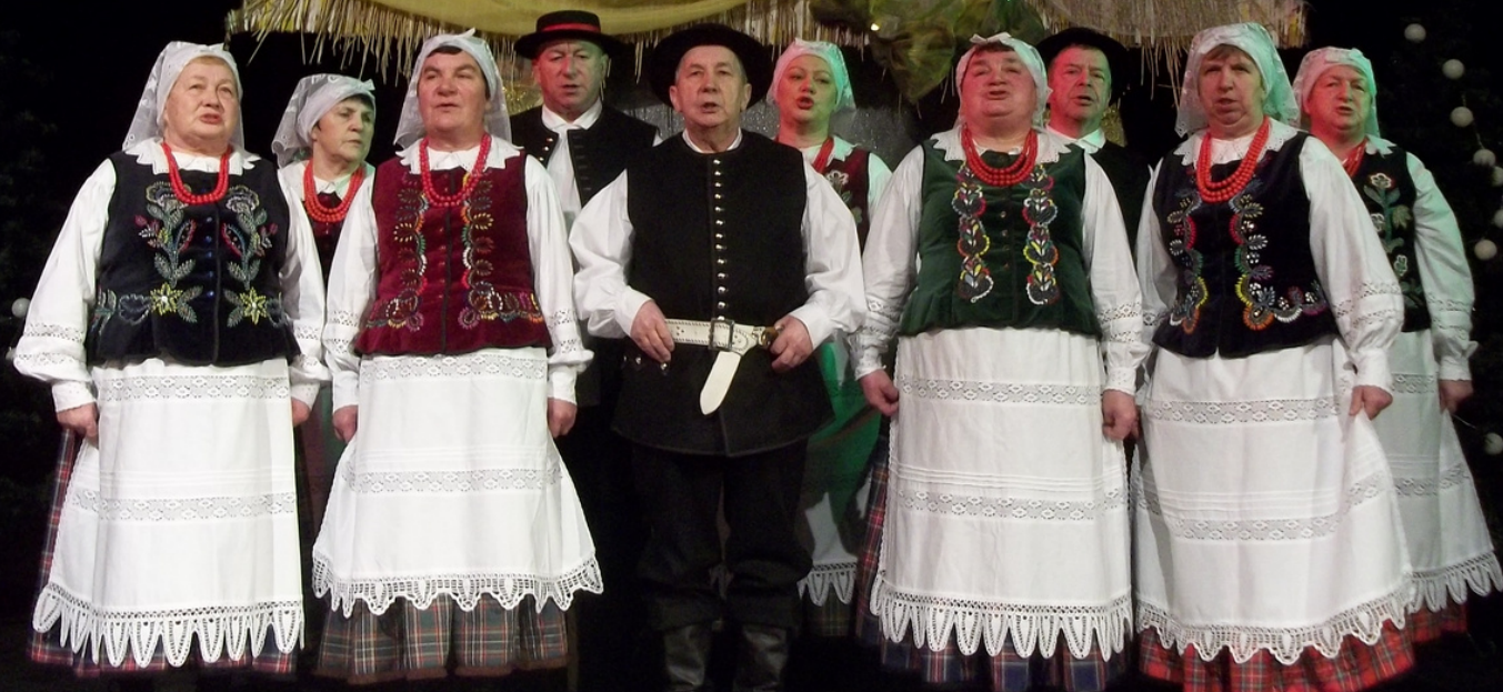
XXIII Przegląd „Godnie Święta” Przeworsk, 2018 r.