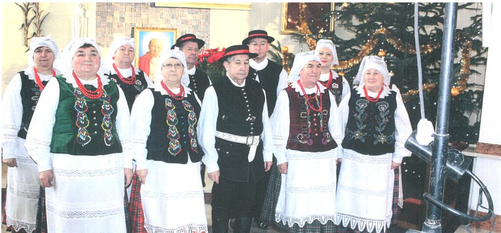
Przeгляд Koled i Pastorałek Pawłosiów, 2018 r.