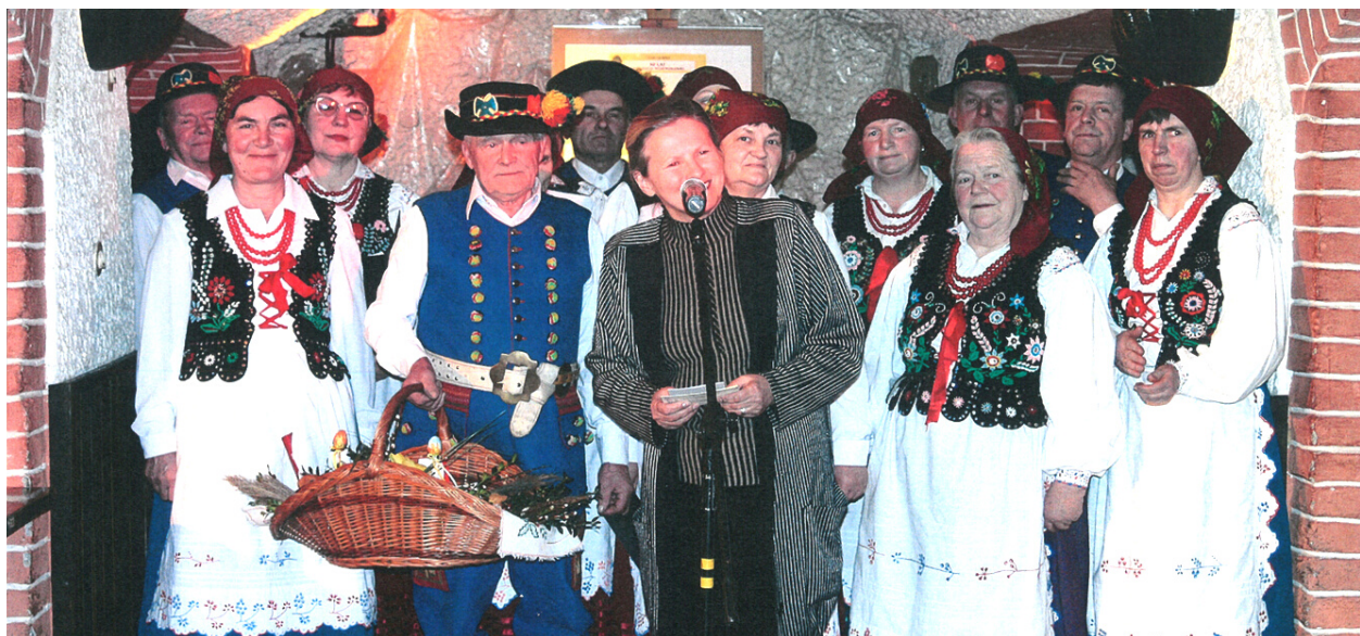
Klub Piwnice Przemysł - " Kwietna Niedziela " 2005 r.