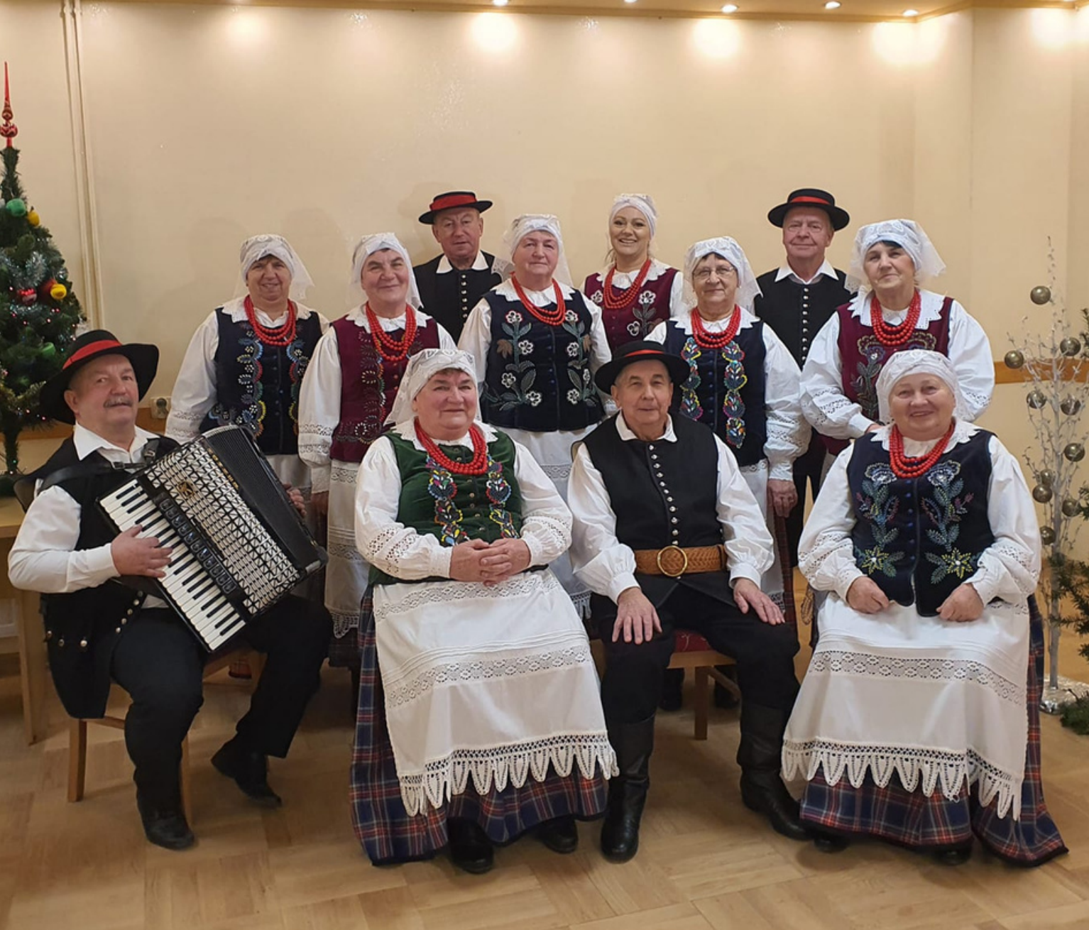
DOLANIE z Gniewczyny Trynieckiej w gronie wyróżnionych podczas VI Międzynarodowego Festiwalu Kolęd i Pastoralek - Kalwaria Pałacowska, 2021 r.