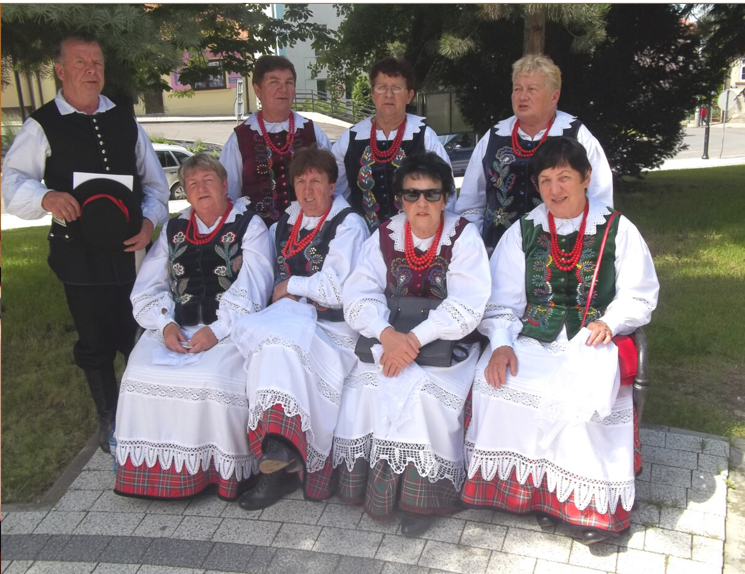
Wojewódzki Przegląd Wiejskich Zespołów Artystycznych Tyczyn, 2018 r.