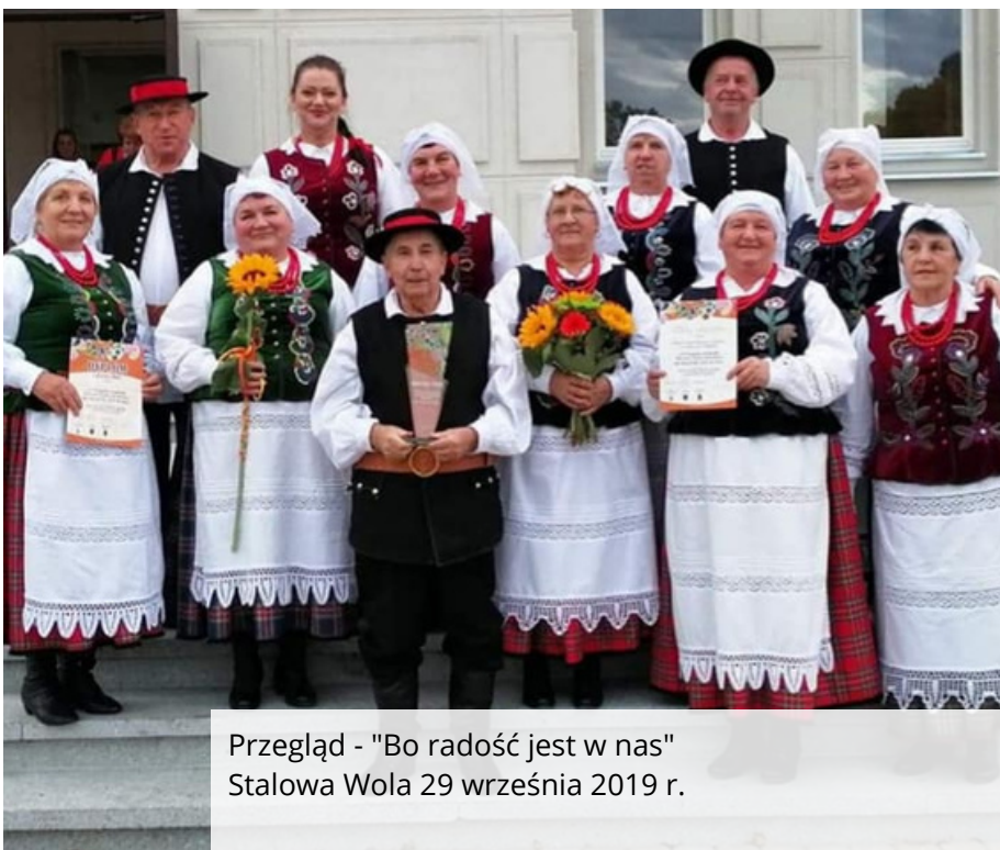
Przegląd - "Bo radość jest w nas" Stalowa Wola 29 września 2019 r.