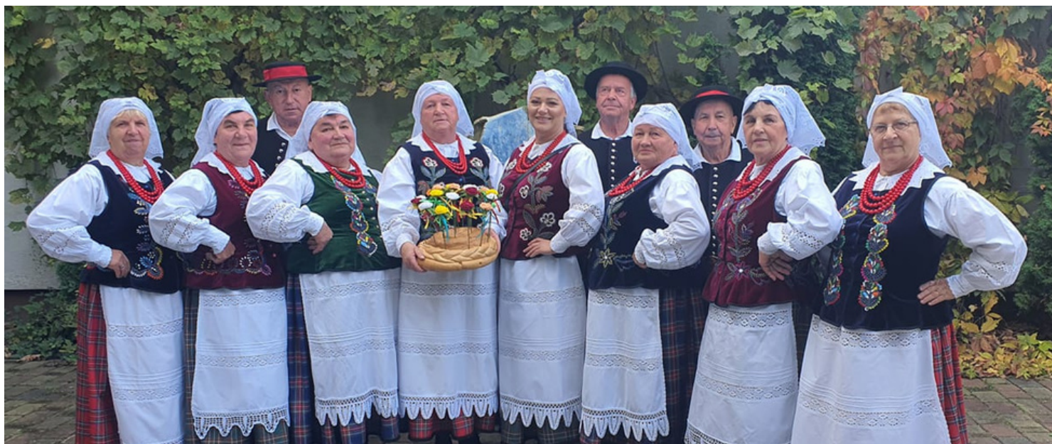
I miejsce dla Zespołu DOLANIE na Przeglądzie " Bo radość jest w nas" w Stalowej Woli, 2021 r.