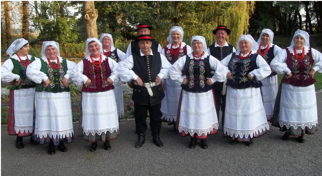
"Festyn pod Platanem" Przegląd Pieśni Obrzędowych Zarzecze, 2017 r.