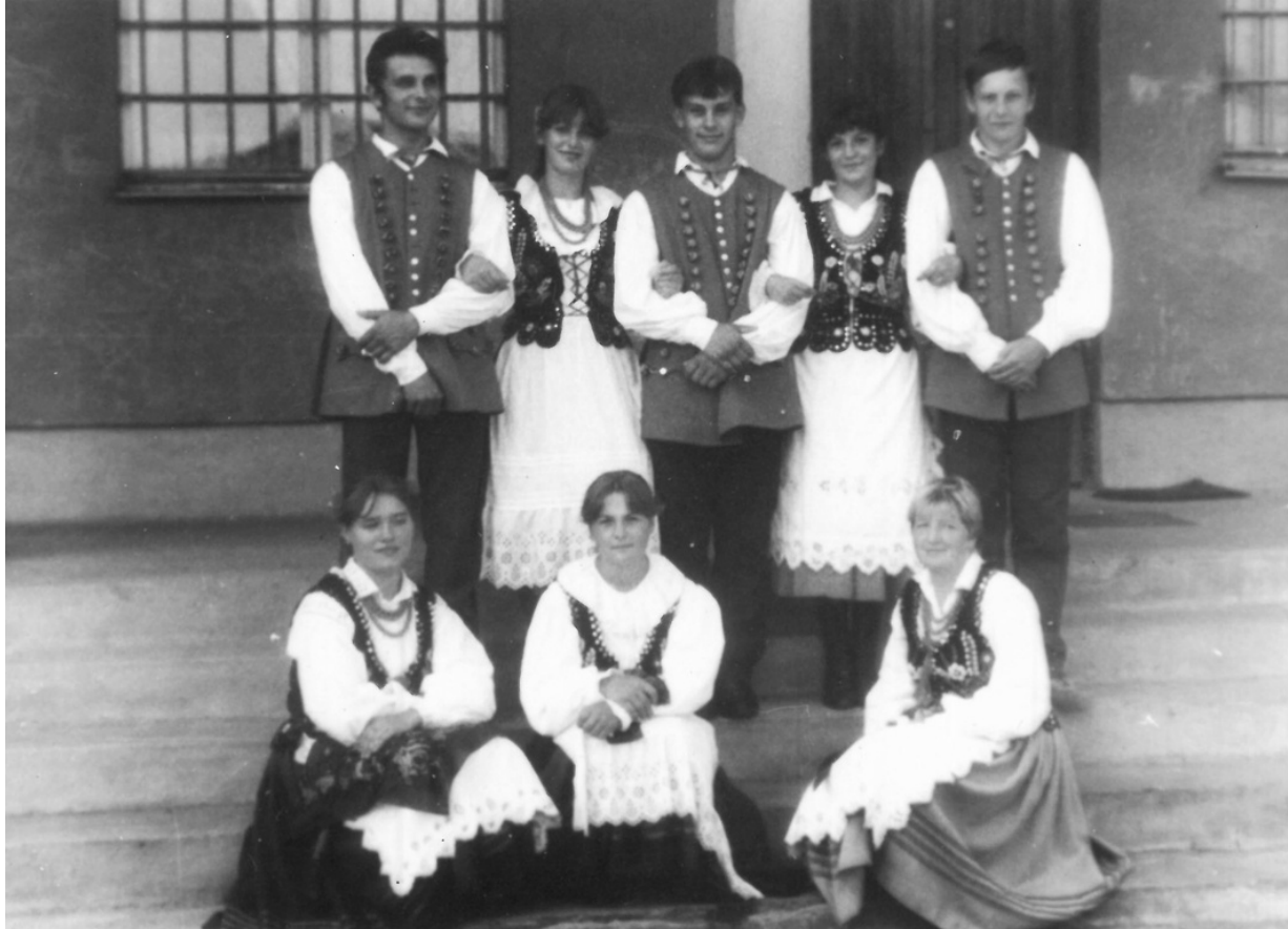
Święto Ludowe Tryńcza 1985 r.