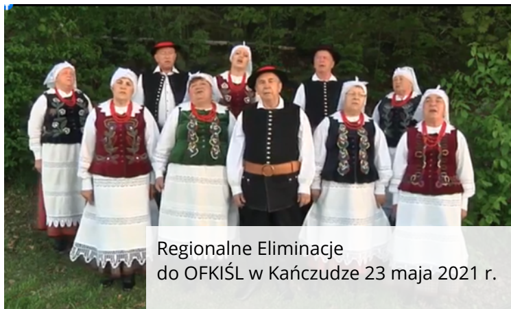
Regionalne Eliminacje do OFKIŚL w Kańczudze 23 maja 2021 r.