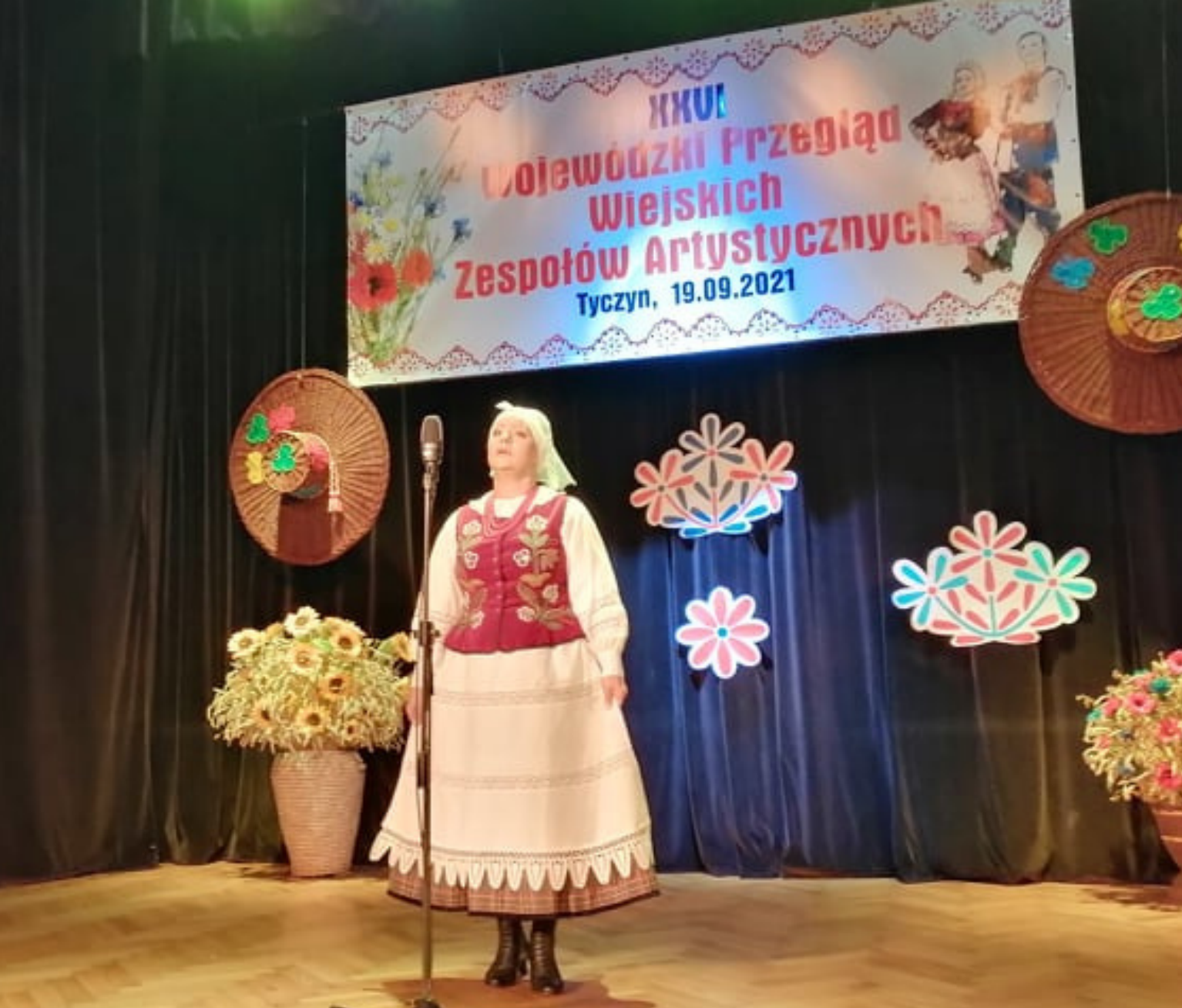
XXVI Wojewódzki Przegląd Wiejskich Zespołów Artystycznych w Tyczynie, 2021 r.