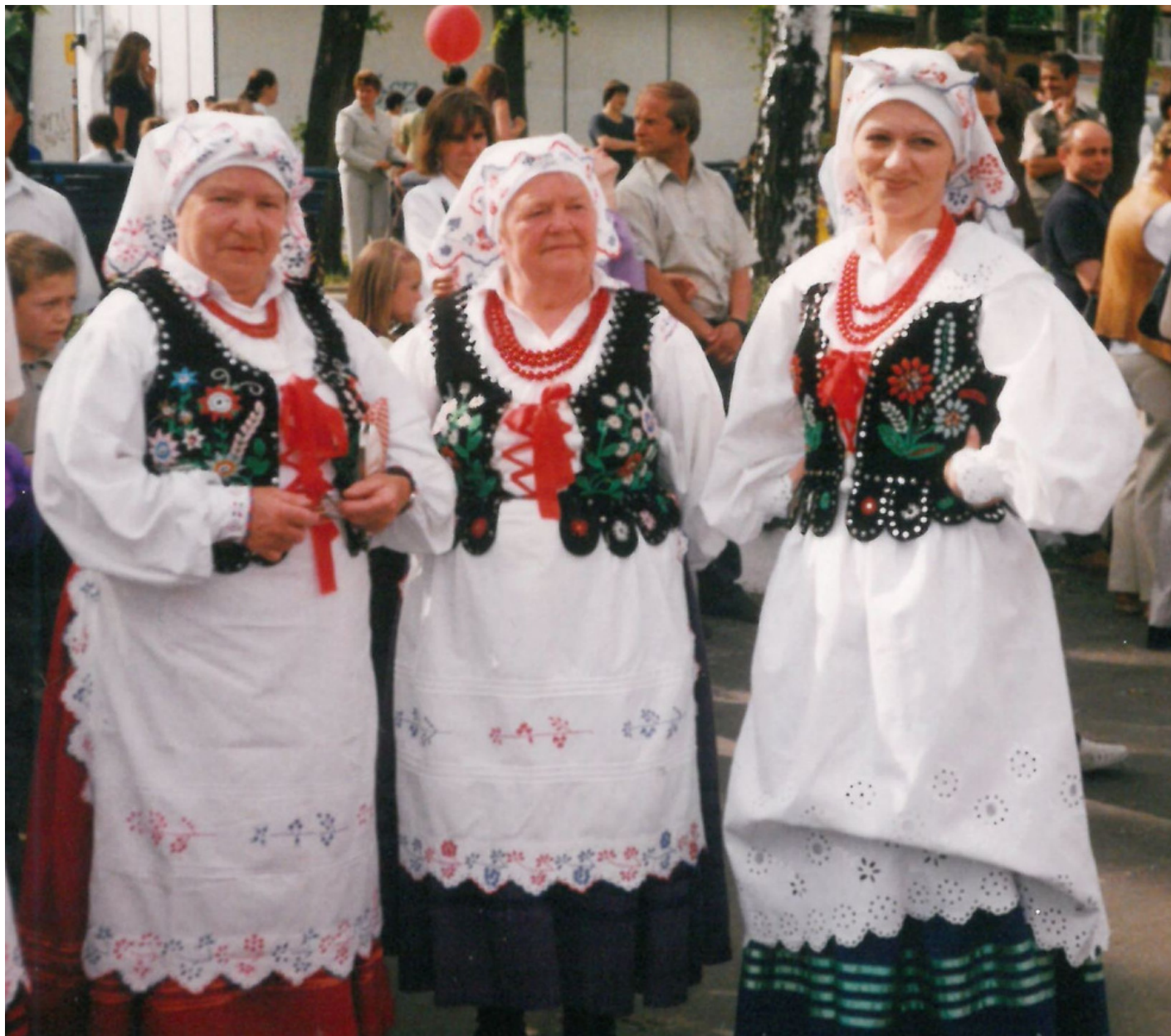
Eliminacje do Ogólnopolskiego Festiwalu Kapel i Śpiewaków Ludowych w Kazimierzu Dolnym