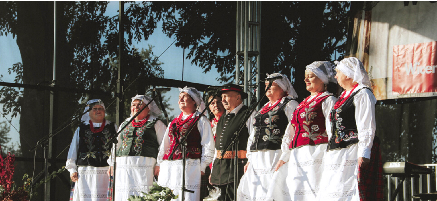
Występ podczas Kulinarного Powitania Jesieni w Gniewczynie Łańcuckiej, 2021 r.