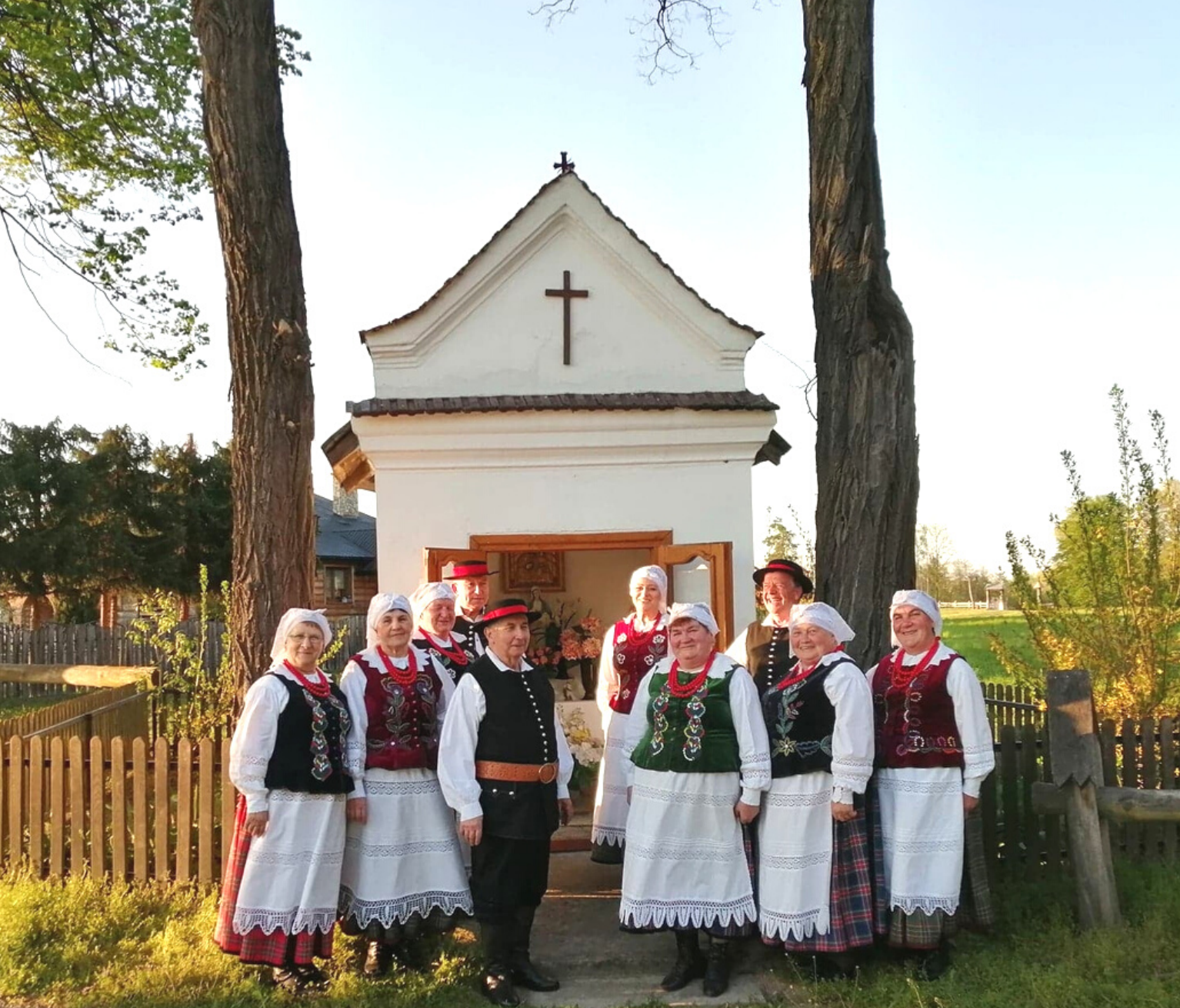
Ludowy Zespół Śpiewaczy "Dolanie" śpiewa pieśni Maryjne pod kapliczką w Gniewczynie Trynieckiej, 2021 r.