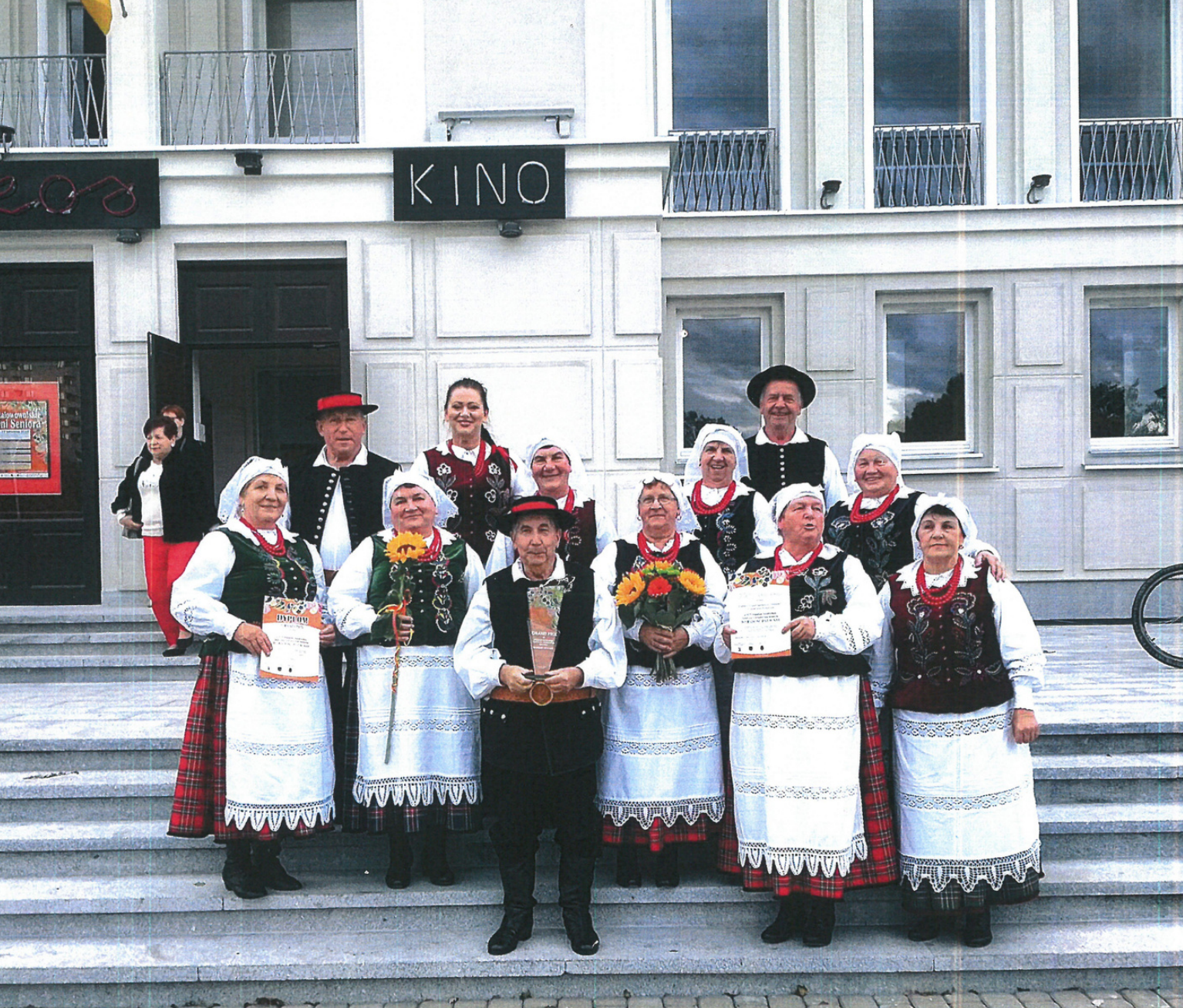
Przeгляд - "Bo radość jest w nas." Stalowa Wola, 2019 r.