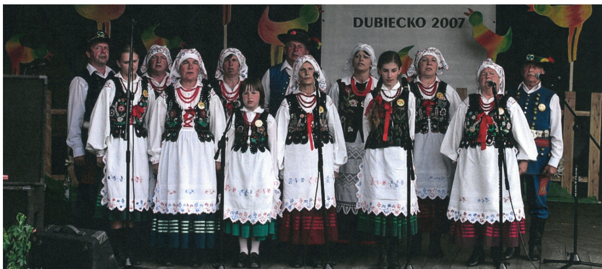
Przeгляд Kapel Ludowych i Zespołów Śpiewaczych Dubiecko 2007 r.