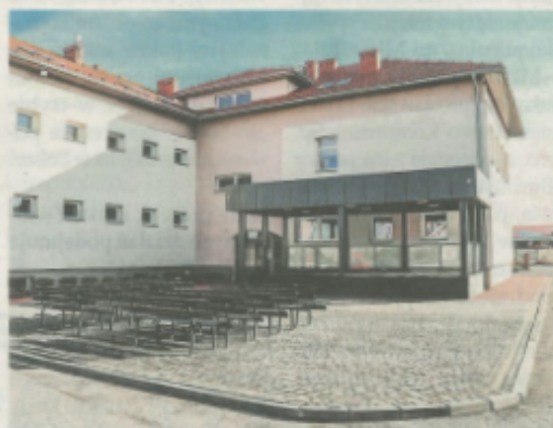
Patio przy Gminnym Centrum Kultury i Czytelnictwa.