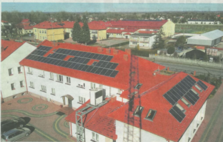
Instalacja fotowoltaiczna na budynku Urzędu Gminy w Tryńczy.

Realizacja wszystkich podejmowanych przedsięwzięć i realizowanych inwestycji nie byłaby możliwa gdyby nie dobra współpraca, zarówno samego samorządu Gminy Tryńcza, jak również z innymi instytucjami. AS