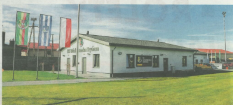
Kompleks Sportowy w Tryńczy.