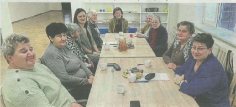
Klub Senior + w Gniewczynie Łańcuckiej.