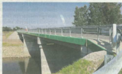
Nowy most na Wisłoku w Gniewczynie Łańcuckiej.