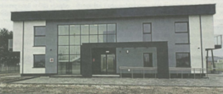
Centrum Opiekuńczo Mieszkalne