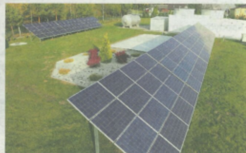
Instalacja fotowoltaiczna przy stacji Uzdatniania Wody w Jagielle.