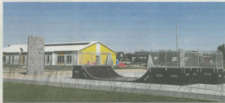
Skate Park przy kompleksie sportowym w Tryńczy.