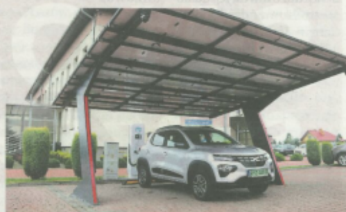
Carport wraz ze stacją do ładowania pojazdów.

na które pozyskała środki z Rządowego Funduszu Polski Ład. Będzie to Budowa Obiektu kulturalno-rekreacyjnego w Gniewczynie Łańcuckiej (wartość inwestycji wyniesie 4,8 mln zł) oraz budowa dwóch wodnych placów zabaw w miejscowości Tryńcza i Gniewczyna