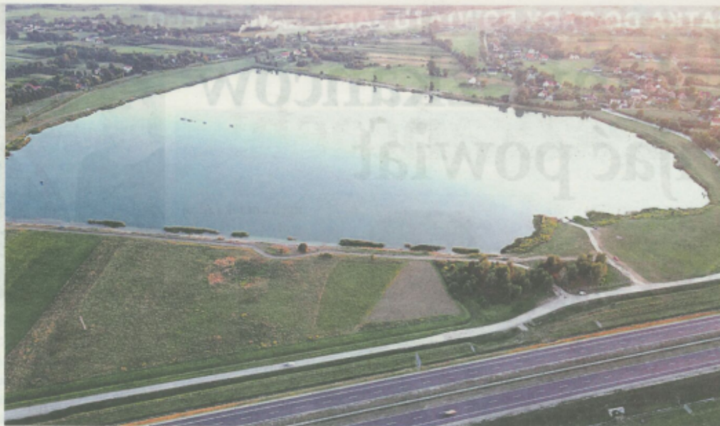
Zbiornik w Gniewczynie Łańcuckiej przeznaczony na cele rekreacyjne.

to prawie 3 mln zł. W 2020 roku w Głogowcu powstała strzelnica sportowa, której budowa wyniosła 2 mln zł. Jest to pierwszy tego typu obiekt w regionie.