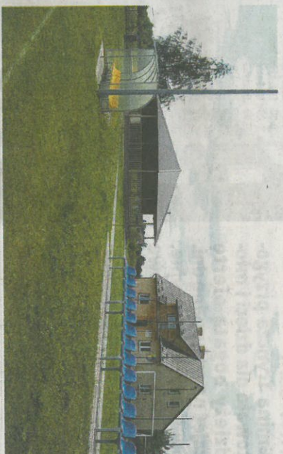
Stadion LKS „Huragan”