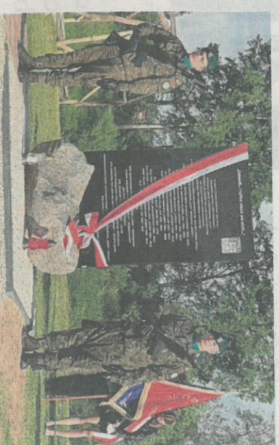
Odsłonięcie pamiątkowej tablicy upamiętniającej bohaterów akcji „Julia 1944” w Tryńczy

„Julia” to kryptonim akcji dywersyjnej przeprowadzonej na początku kwietnia 1944 przez grupy Kedywu KG AK na liniach kolejowych na Rzeszowszczyźnie. Przerwa w ruchu kolejowym spowodowana tą akcją trwała w sumie ponad 100 godzin. ©©