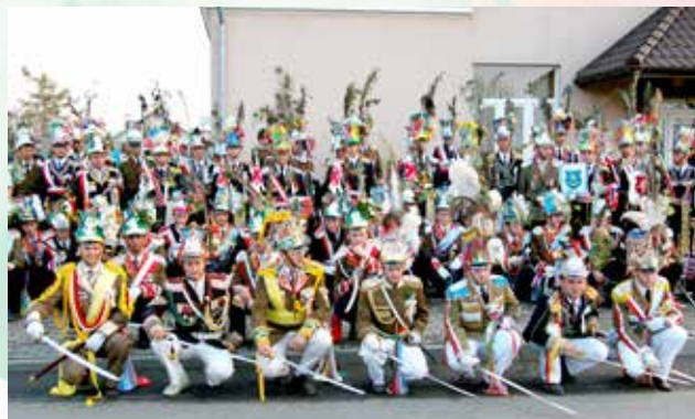
Powrót oddziałów z parady w Raniszowie