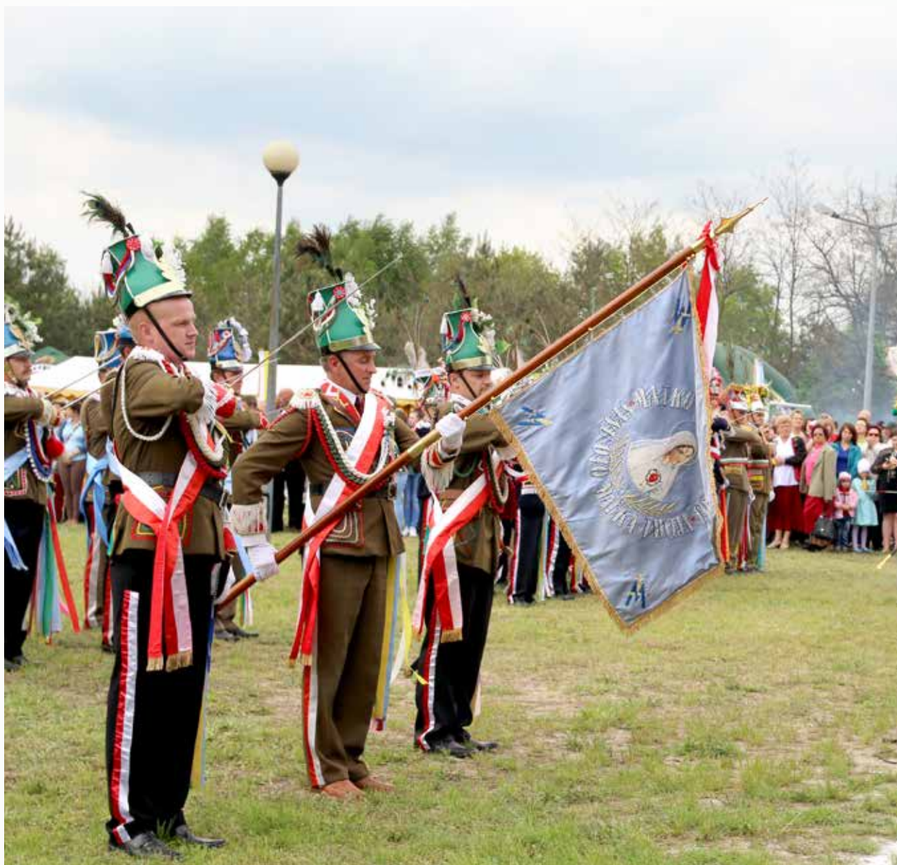
Udział w XI Ogólnopolskiej i XXII Podkarpackiej Paradzie Straży Wielkanocnych Turki 2014 w Radomyślu nad sanem