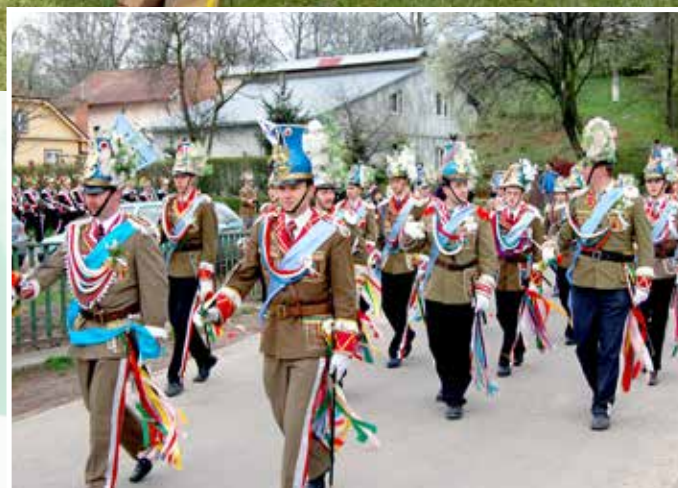
Gościnny występ na Gminnym Przełądzie Turków w Rozbożu