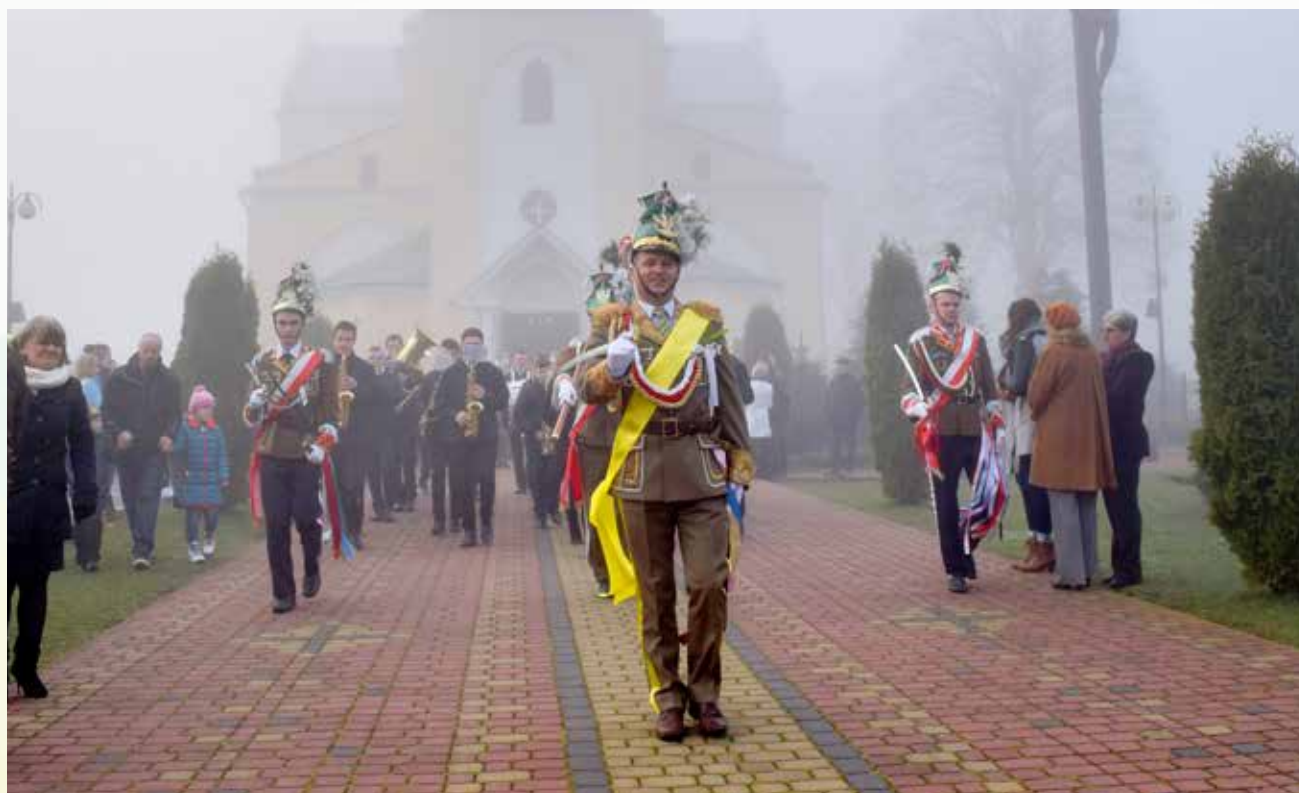
Pokaz musztry paradnej przed Kościołem w Tryńczy