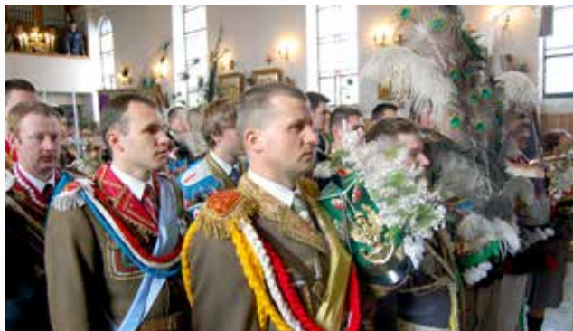
Gminna parada Turków w Jagielle