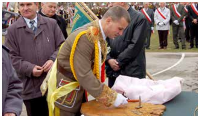
Nadanie sztandaru w Jagielle