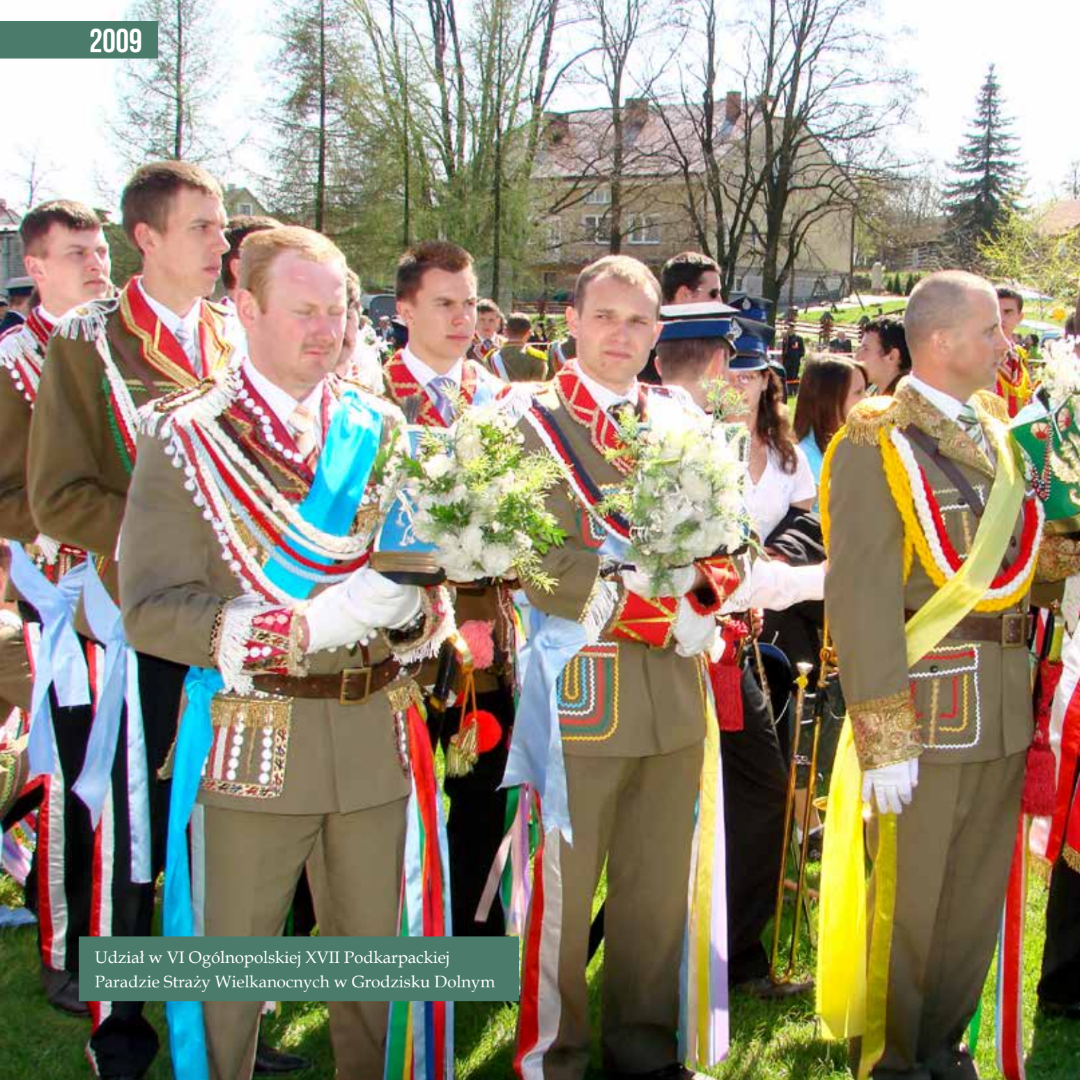
Udział w VI Ogólnopolskiej XVII Podkarpackiej Paradzie Straży Wielkanocnych w Grodzisku Dolnym