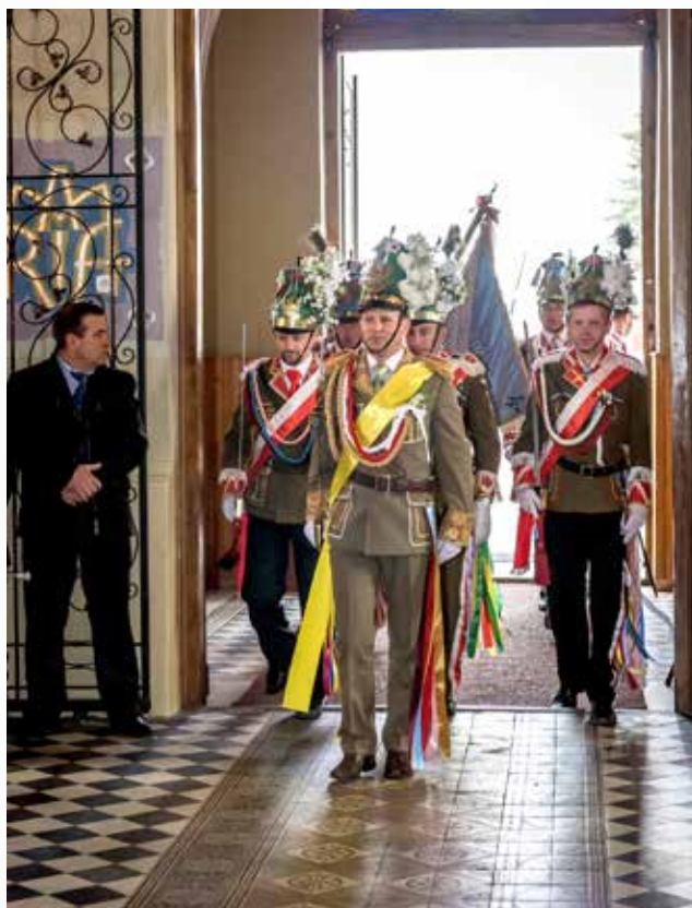
XXII Ogólnopolska i XXIII Podkarpacka Parada Staży Wielkanocnych Turki 2015 w Gniewczynie Trynieckiej