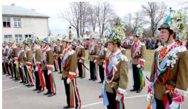
Gminna parada Turków w Jagielle