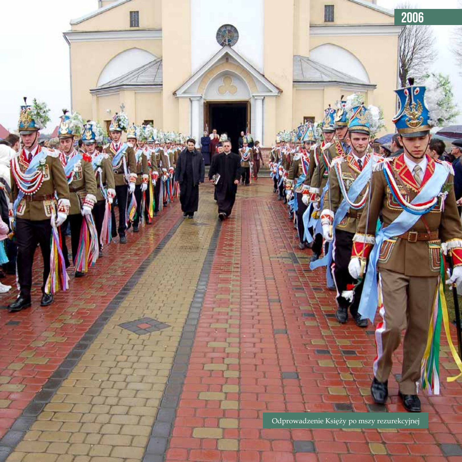
Odprawienie Księży po mszy rezurekcyjnej