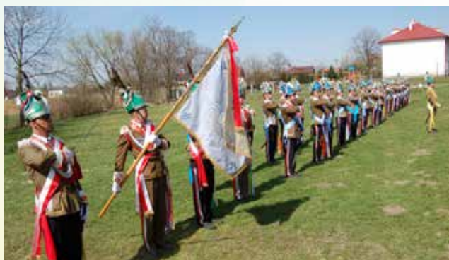
Pokaz musztry paradnej w Ubieszynie