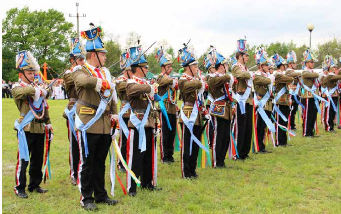
Udział w XI Ogólnopolskiej i XXII Podkarpackiej Paradzie Straży Wielkanocnych Turki 2014 w Radomyślu nad sanem