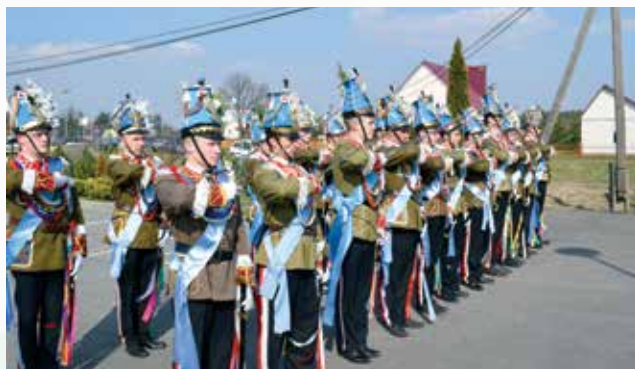
Pokaz musztry paradnej w Wólce Małkowej