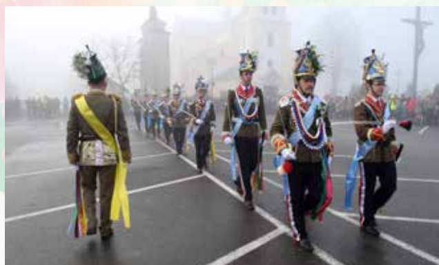
Pokaz musztry paradnej przed Kościołem w Tryńczy