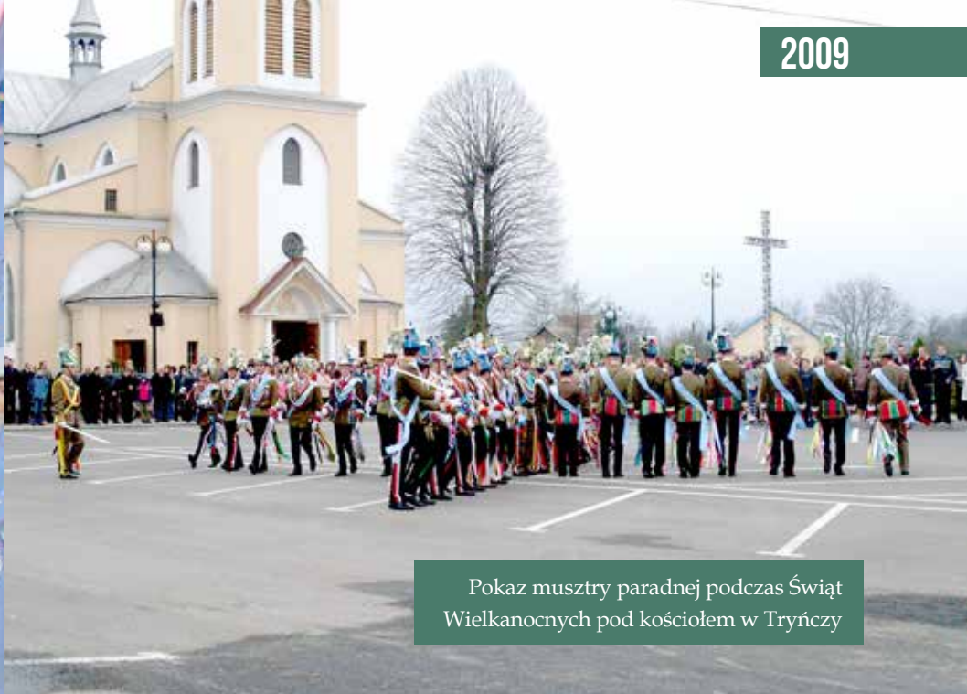
Pokaz musztry paradej podczas Świąt Wielkanocnych pod kościołem w Tryńcy