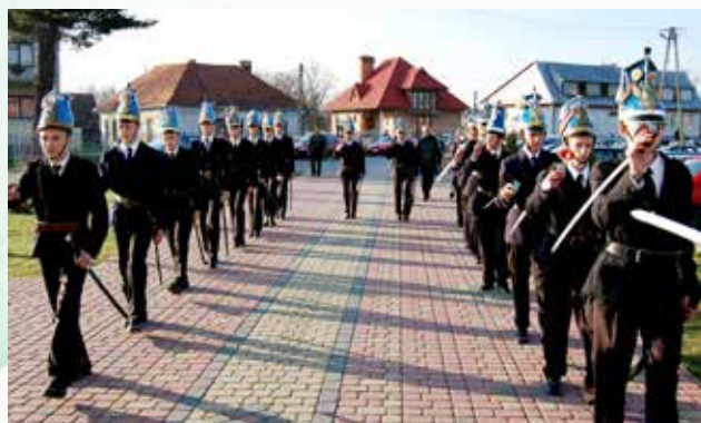
Uroczystości mszalne w Wielkim Tygodniu