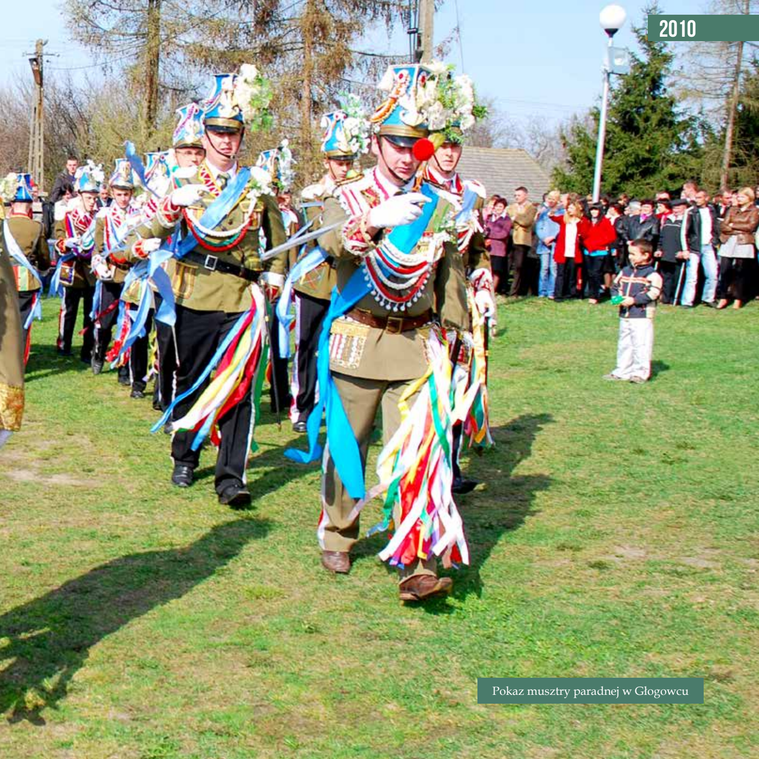
Pokaz musztry paradej w Głogowcu