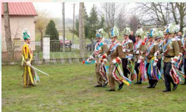
Pokaz musztry w Głogowcu