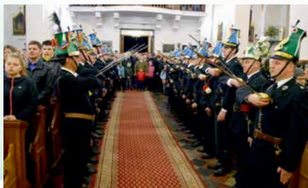
Uroczystości Kościelne podczas Świąt Wielkanocnych