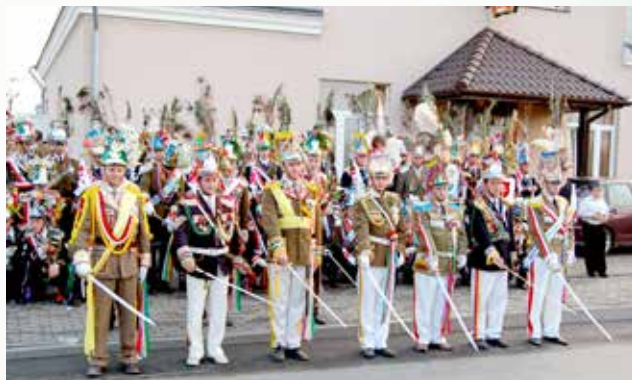
Powrót oddziałów z parady w Raniszowie