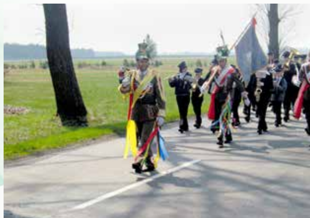
Parada Straży Grobowych

2005 r. w Gniewczynie Trynieckiej odbyła się XIII Podkarpacka, a II Ogólnopolska Parada Straży Grobowych „Turki 2005”. Udział w niej wzięło 36 straży grobowych oraz 9 orkiestr dętych - łącznie około 1600 osób