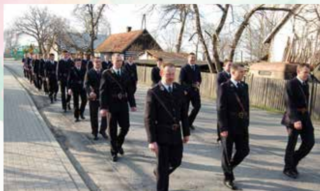
Przemarsz do Krzyża w Wielką Sobotę