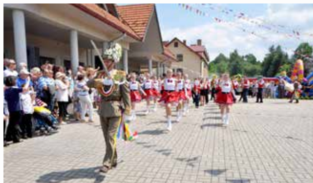
Gościnny wyjazd do Jeleniej Góry