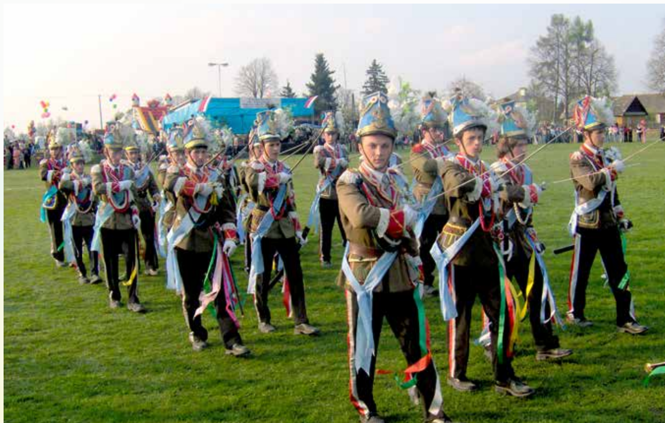
Parada Straży Grobowych Turki

2005 r. w Gniewczynie Trynieckiej odbyła się XIII Podkarpacka, a II Ogólnopolska Parada Straży Grobowych „Turki 2005”. Udział w niej wzięło 36 straży grobowych oraz 9 orkiestr dętych - łącznie około 1600 osób