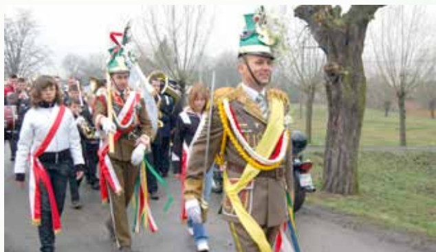
Pokaz musztry w Majdanie Zbydniowskim podczas V Ogólnopolskiej i XVI Podkarpackiej Parady Wielkanocnej „Turki 2008”