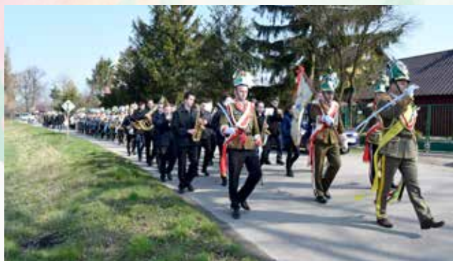
Pokaz musztry paradnej w Głogowcu