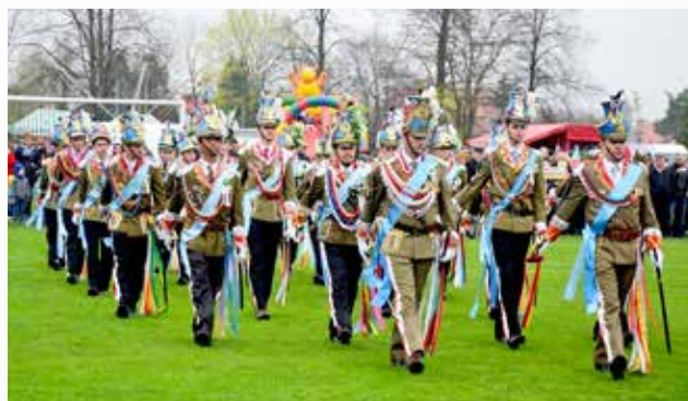
XXIII Ogólnopolska i XXIV Podkarpacka Parada Staży Wielkanocnych Turki 2016 w Nowej Sarzynie