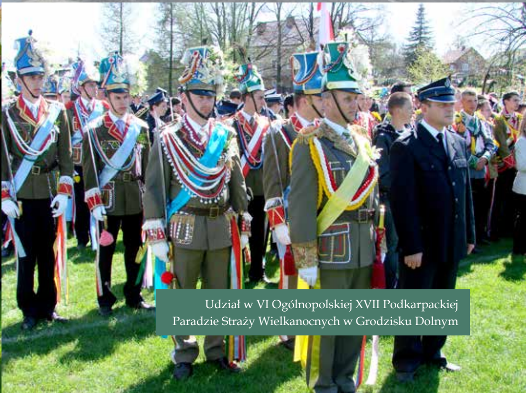
Udział w VI Ogólnopolskiej XVII Podkarpackiej Paradzie Straży Wielkanocnych w Grodzisku Dolnym