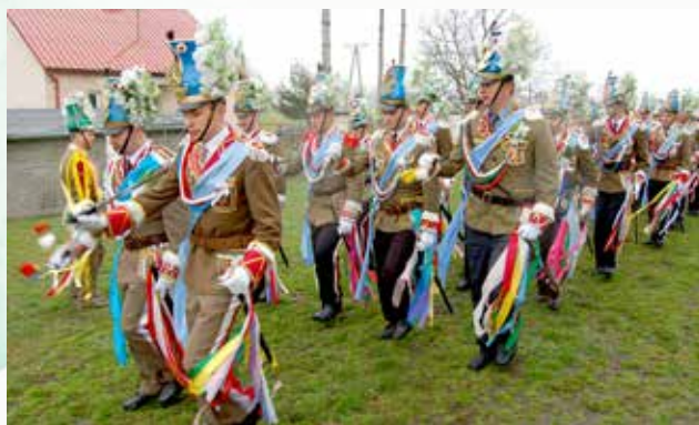
Pokaz musztry w Głogowcu