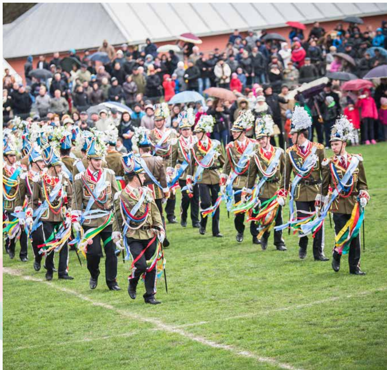
XXII Ogólnopolska i XXIII Podkarpacka Parada Staży Wielkanocnych Turki 2015 w Gniewczynie Trynieckiej