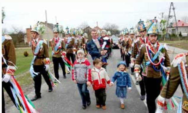
Przemarsze podczas Świąt Wielkanocnych