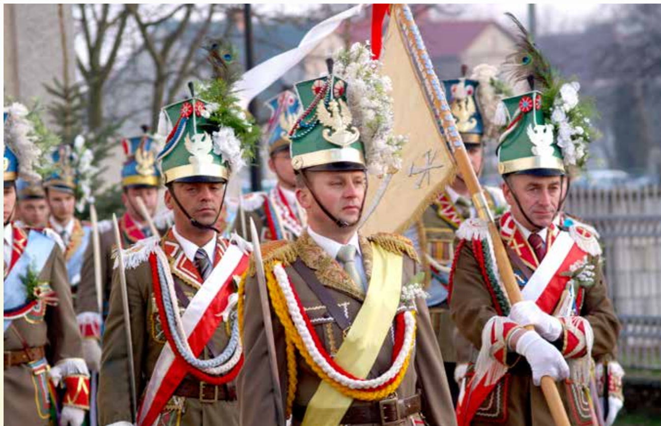
Udział w uroczystościach Świąt Wielkanocnych