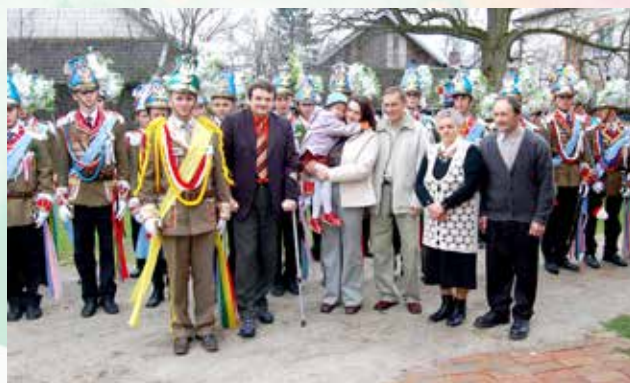
Przemarsze podczas Świąt Wielkanocnych