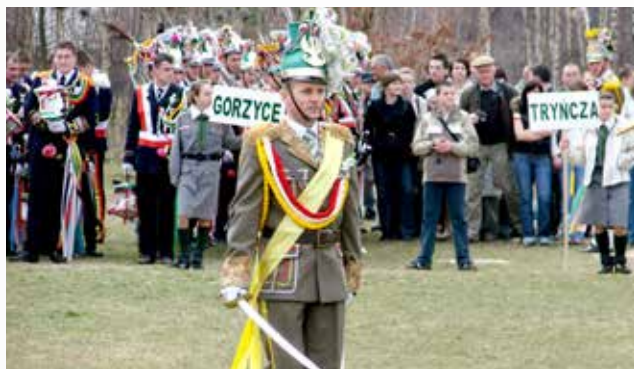
Gminna parada Turków w Jagielle