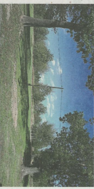
Teren przy orliku sportowym, obok którego powstanie obiekt kulturalno – rekreacyjny w Gniewczynie Łańcuckiej.

Program Inwestycji Strate- gicznego Funduszu Polskiej Ład: TP