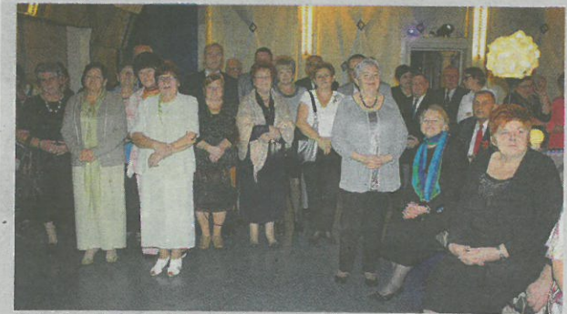
WZ Członkowie koła diabetyków obejrzeni program artystyczny w wykonaniu małych tancerzy.