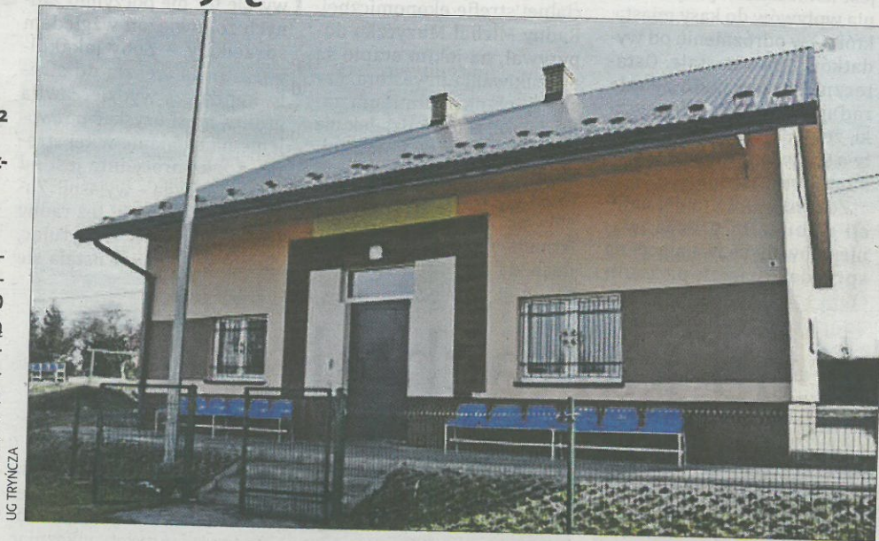
Prace remontowe przy stadionach w Gorzycach i Tryńczy już ruszyły.

Prace przy modernizacji stadionów sportowych na terenie gminy pochłoną 580 tysięcy złotych i możliwe są dzięki 267 tys. zł dofinansowania ze środków Ministerstwa Sportu i Turystyki. Póki co ruszyły te mniej kosztowne prace. Ponad 60 tys. zł wyniesie koszt rozpoczętego właśnie remontu szatni LKS w Gorzycach, gdzie poddasze zostanie zaadaptowane na pomieszczenia użytkowe, w planach jest także remont sanitariatów. 20 tys. zł przeznaczono na prace remontowe w szatni LKS w Tryńczy, gdzie niezbędne jest odmalowanie ścian i drzwi wewnątrz budynku, a także remont sanitariatów. Kolejny etap działań obejmie stadion w Jagielle, gdzie również przewidziano remont szatni z adaptacją poddasza na pomieszczenia użytko-